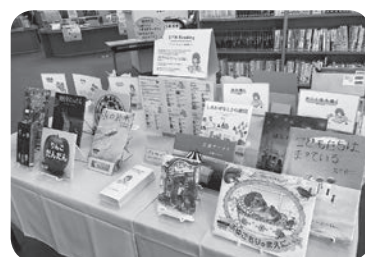
BPM Reading コーナー