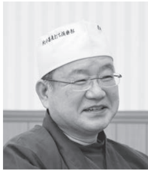
北斗蕎麦打ち倶楽部会長