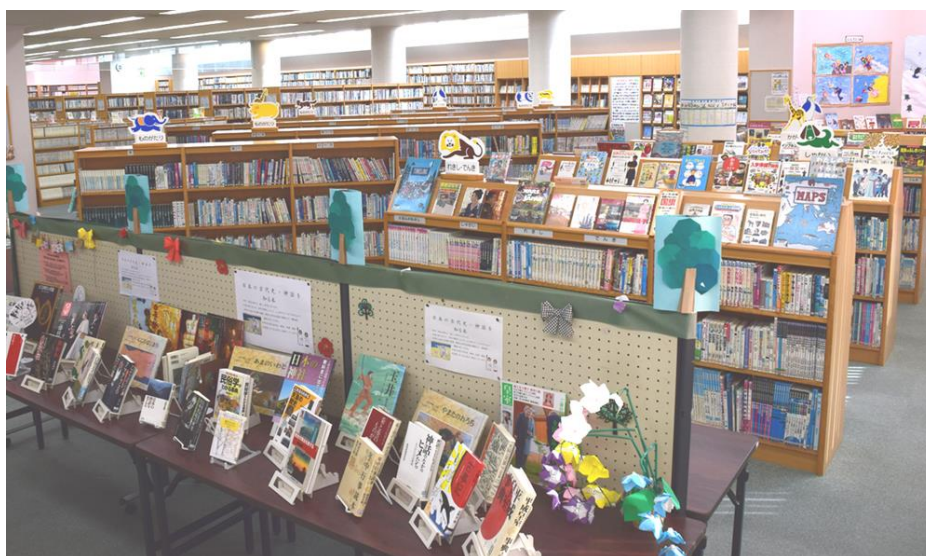
北斗市立図書館本館内の様子