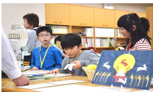
一日図書館司書体験の様子