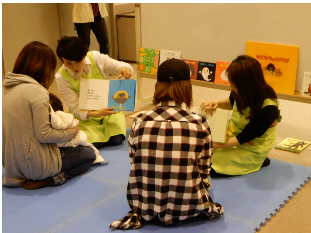
保健センターにおけるブックスタート事業の様子