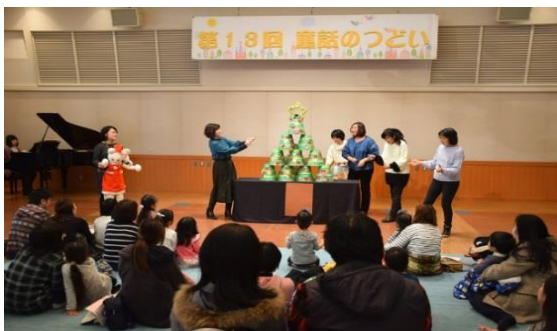
童話のつどいの様子