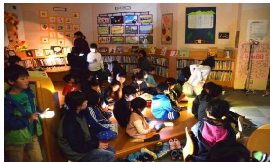
夜の図書館の様子