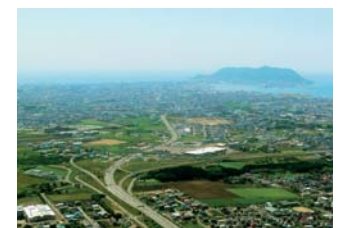
複数の自動車専用道路の結節点となる函館IC(函館市)