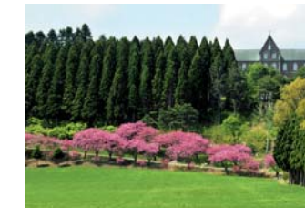
トホク新幹線(北斗市)