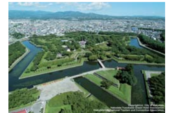
国指定史跡五稜郭跡(函館市)