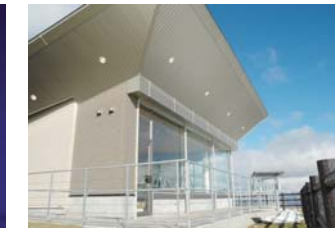
きじひきパノラマ展望台(北斗市)