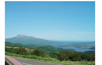
きじひき高原からのパノラマ(北斗市)