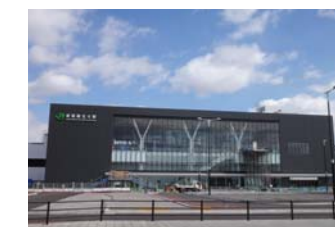
新函館北斗駅(北斗市)