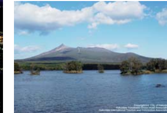
大沼国定公園(七飯町)