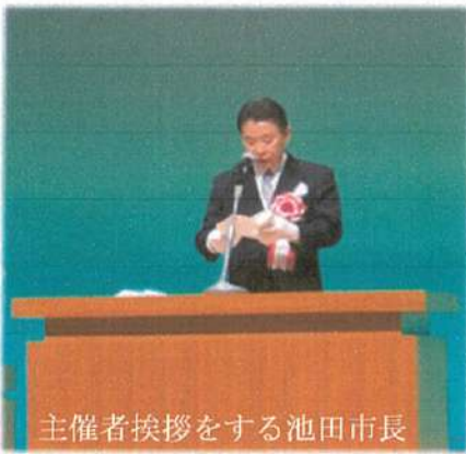
主催者挨拶をする池田市長