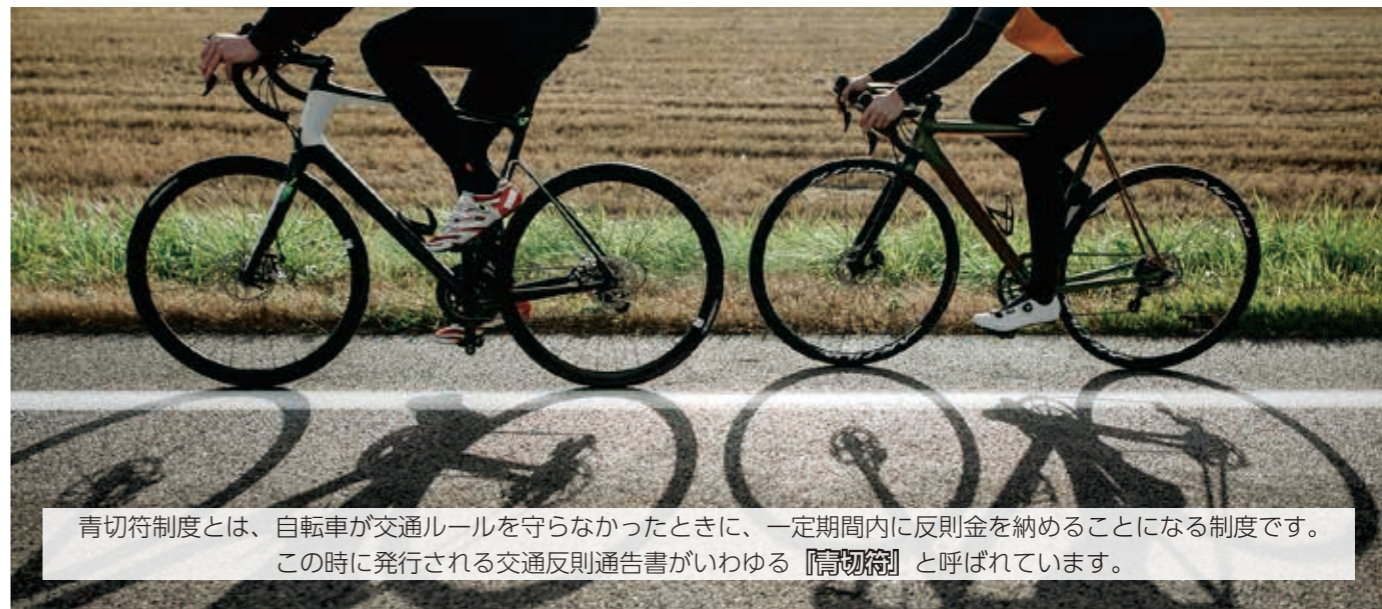
青切符制度とは、自転車が交通ルールを守らなかったときに、一定期間内に反則金を納めることになる制度です。この時に発行される交通反則通告書がいわゆる『青切符』と呼ばれています。

道路交通法の一部改正に伴い、16歳以上が運転する自転車に対して4月から、交通反則通告制度(青切符制度)が適用されました。