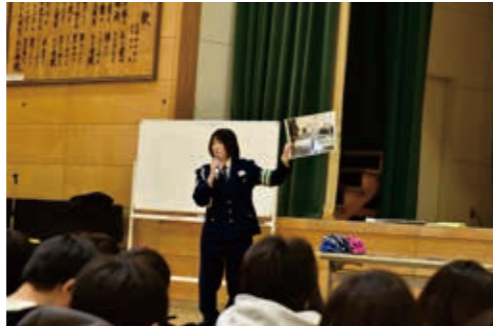
久根別小学校で開催した交通安全教室の様子。交通ルールを学んでもらうため開催しているこの教室は、自治会や町内会などでも開催しています。交通事故を一件でも減らすために、ぜひ交通安全教室をご活用ください。

交通安全教室も実施しています。「交通安全のルールを守ることは当たり前。悪いことをすれば注意されるということも、子どもたちにとって大切な学びです。子どもの頃からの積み重ねで、自分の命を守ることが自然に身についてくれることを願っています」と市の担当者は話します。