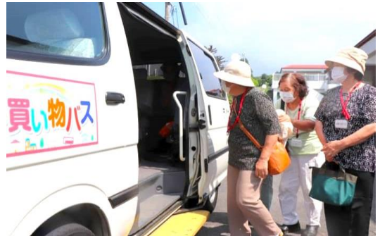
<写真は他の町のバスです>

買い物バスには、添乗員が必要とのことですので、ヘルパーの資格を持つ私の奥さんをお願いしています。発車オーライです。