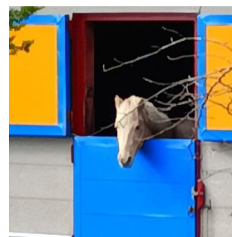
写真 新ひだか町静内の真歌公園の牧場

「ばけばけ」ではありませんが、時代に対応した、町内会づくりを試みたいと思っています。今後ともお力をお貸し願いたいと思います。少し早いですが、よいお年をお迎えくださいネ。