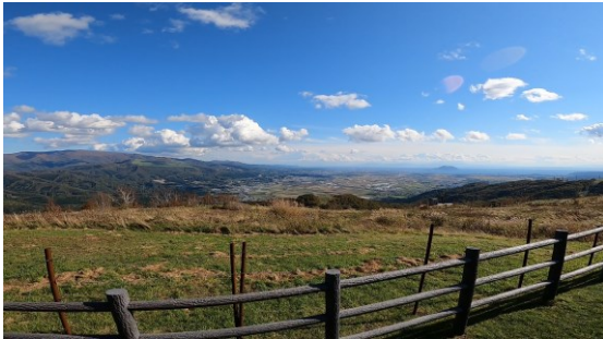
▲展望台からの眺望(北斗市街・函館山方面)