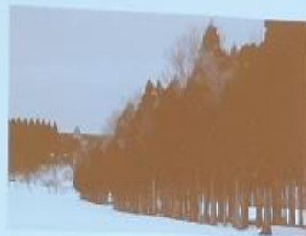
北斗市防災連絡会議