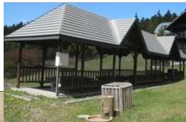
※参考 匠の森バーベキューハウス

春には、桜を見ながらBBQ 夏には、スポーツの後にBBQ 秋には、食欲に任せてBBQ