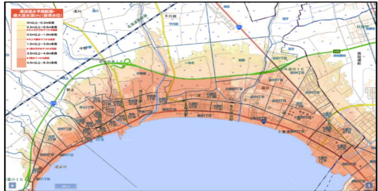
日本海溝・千島海溝沿い巨大地震 (R3想定)