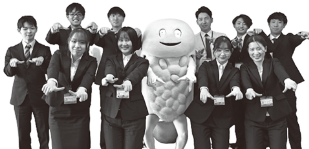
（令和5年新規採用職員）