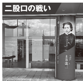
令和元年度設置 (新函館北斗駅)

※「二股口の戦い」の設置は、当初は二股口戦場跡への設置が予定されていたものの、安全面などへの配慮から、多くの人々が訪れる新函館北斗駅が選定されました。