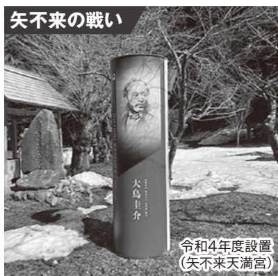
令和4年度設置 (矢不來天満宮)

3月22日、北斗市茂辺地の矢不來天満宮に、戊辰戦争終結150周年を記念したモニュメントが設置されました。本事業によるモニュメントは令和元年度から設置を開始し、これまでは、「二股口の戦い」「松前藩戸切地陣屋」「大野口の戦い」の3基が設置されており、今回で4基目の設置となります。