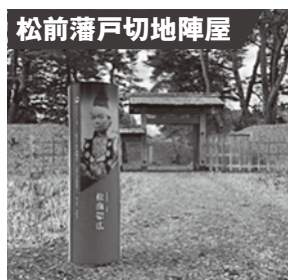
令和2年度設置 (国指定史跡松前藩戸切地陣屋跡)