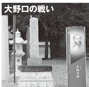
令和3年度設置 (意富比神社)