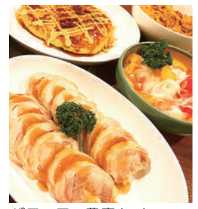
バラエティ豊富なメニュー