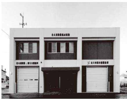
改築した北斗消防団第5分団詰所

新詰所についての質問や消防団活動にご興味がある方は、お気軽にお問い合わせください。