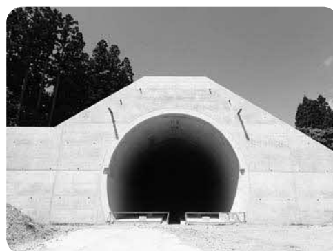
渡島トンネル入口（施工完了）

これに対し、セレン濃度の高い数値は滞水が原因と言いつけているが理論的根拠も失われているのではないかと、セレンの濃度が2カ所の観測孔で環境基準を超えていることについて現状の対策をいつ改善するのか、新しい受入地に関し候補地を最初に検討するのは機構なのか市なのかなどの質疑応答を行いました。