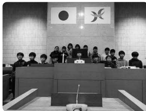
議席にて職員からの説明を受けたあと、議長席を囲んで記念撮影する萩野小学校の子どもたち

令和4年10月23日、北斗市森林・林業・林産業活性化議員連盟が、きじひき高原にエゾヤマザクラ2本を植樹しました。