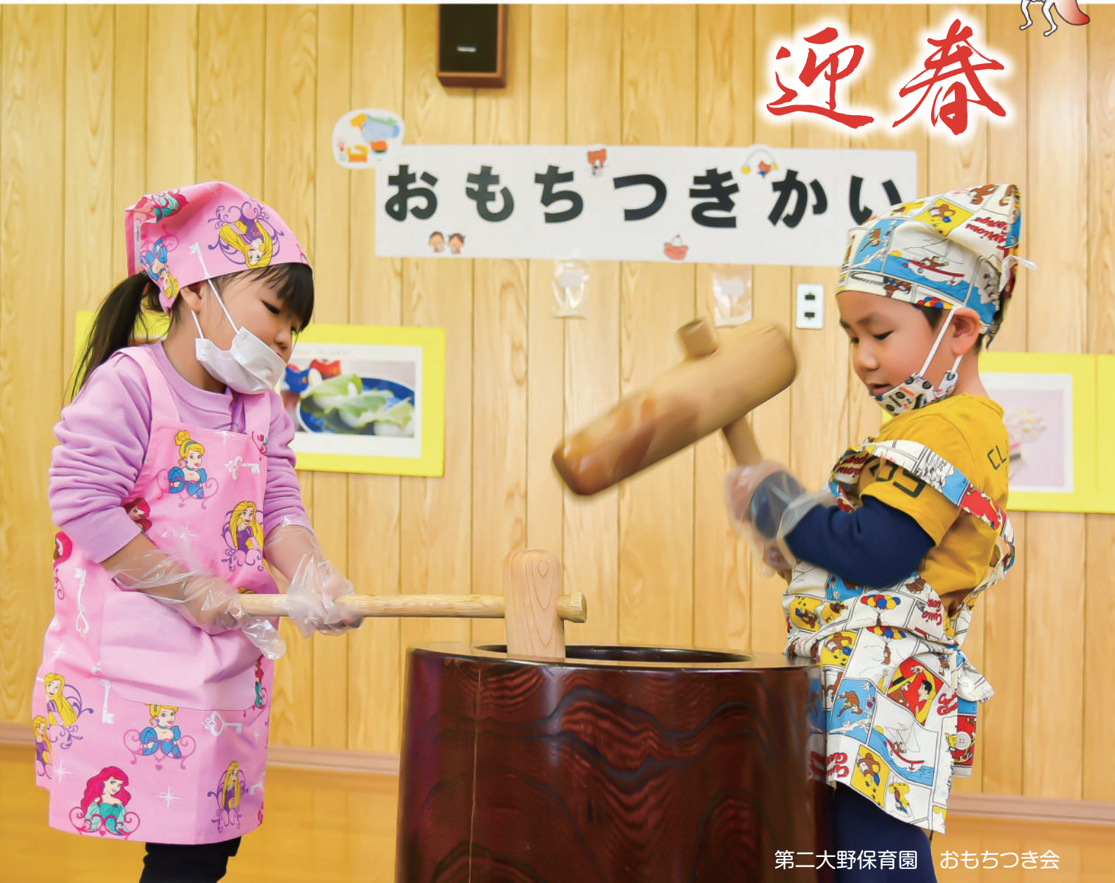
第二大野保育園 おもちつき会