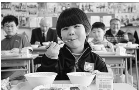
沖川小学校での給食の様子

寄贈いただいたお米は、12月1日、小中学校の学校給食で提供されました。市内の新鮮な農産物を食べることで、「北斗市産」の食材に関心や愛着を持ってもらうきっかけになり、子どもたちの食育にもつながっています。