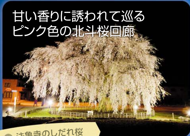
● 法亀寺のしだれ桜

推定樹齢300年、樹高12mの道内最大級のしだれ桜。開花時にはライトアップで演出。近くの大野川沿いの桜並木もライトアップし、「北斗桜回廊」を演出します。