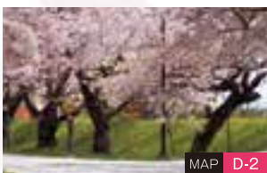
国指定史跡松前藩戸切地陣屋跡