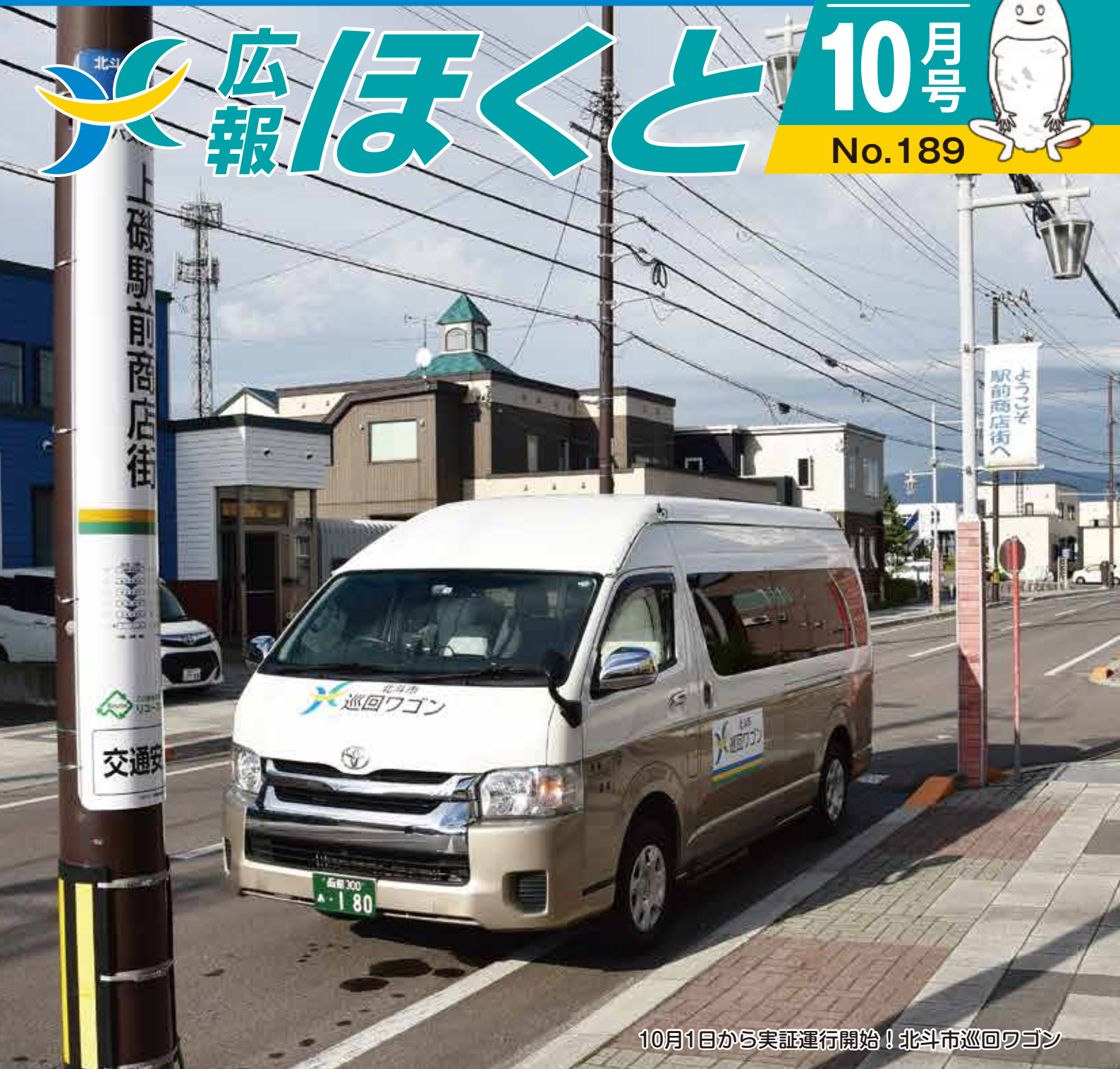
10月1日から実証運行開始！北斗市巡回ワゴン