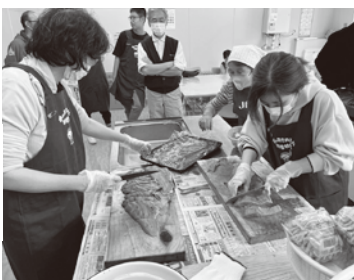
▲鮭捌き体験の様子

10月21日・29日、茂辺地川における鮭の遡上見学に加え、鮭の捌き方やイクラの漬け方を地元の熟練者に学ぶ、鮭づくしのツアーを開催しました。