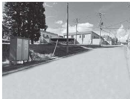
「ゆうあい」入口に設置されている砂箱「市道当別11号線」

答(保健福祉課長) 障害者に関する国の補助事業としては、施設整備の一部についてはありますが、道路などは対象ではないと聞いています。