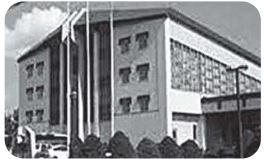
照明更新工事を行う浜分体育センター

令和5年度一般会計補正予算(第3号)にて3億4,564万5千円を増額し、総額を232億4,388万6千円とするものです。